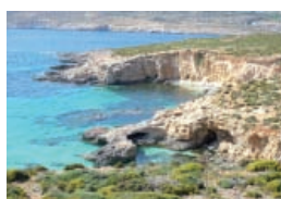
Malta - Comino