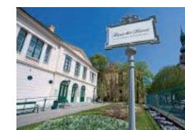
Baden bei Wien