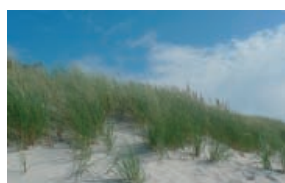
Dänemark - Bornholm