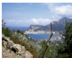
Mallorca - Cala Gat