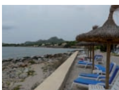
Mallorca - Aguait