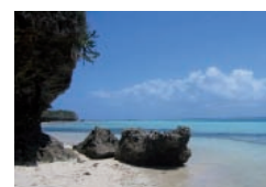
Zanzibar - Tansania